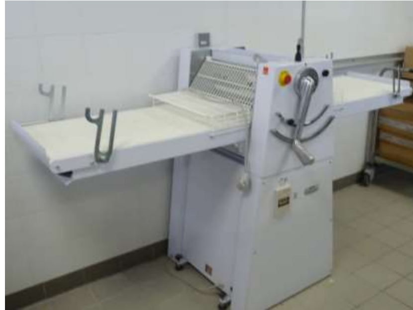
LAMINOIR DISPONIBLE EN LABO PÂTISSERIE