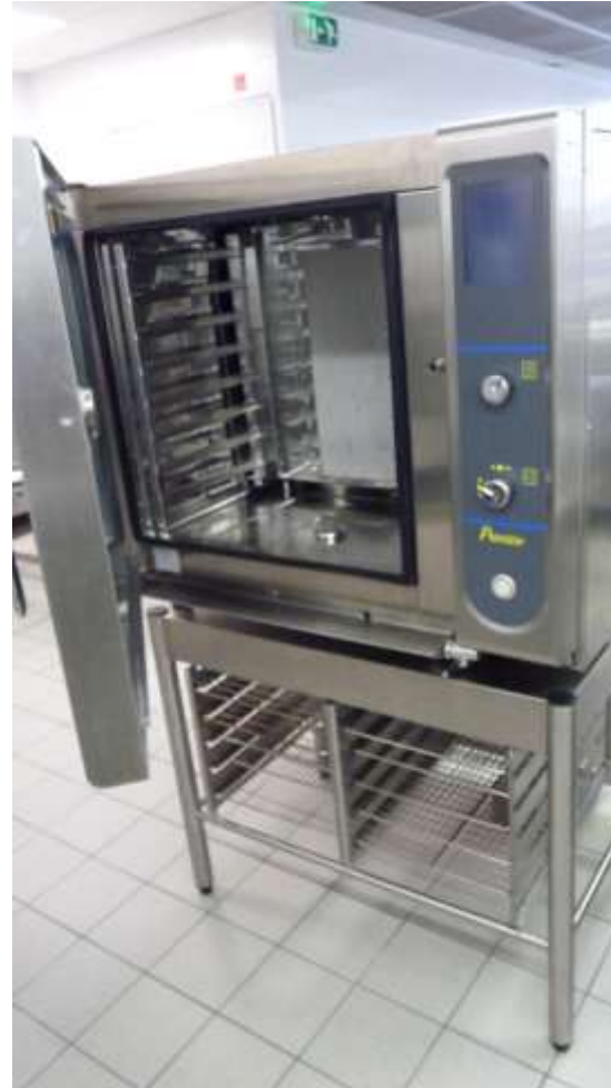
2 FOURS MIXTES GN1 GASTRO 530 X325 MM SELECTION FRANCE – ICC