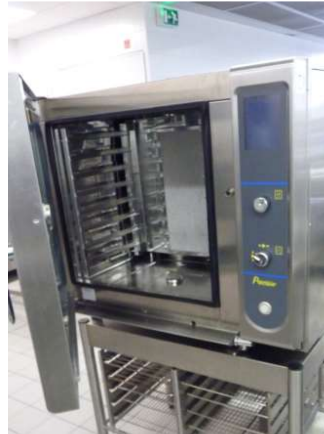
4 FOURS MIXTES GN1 GASTRO 530 X325 MM