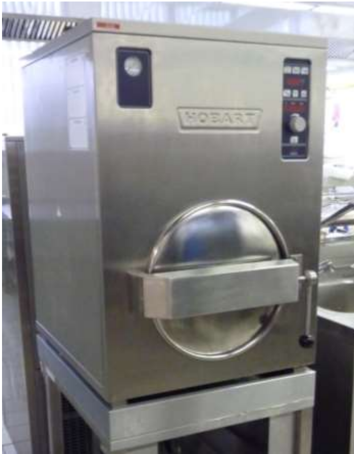
UN FOUR HAUTE PRESSION