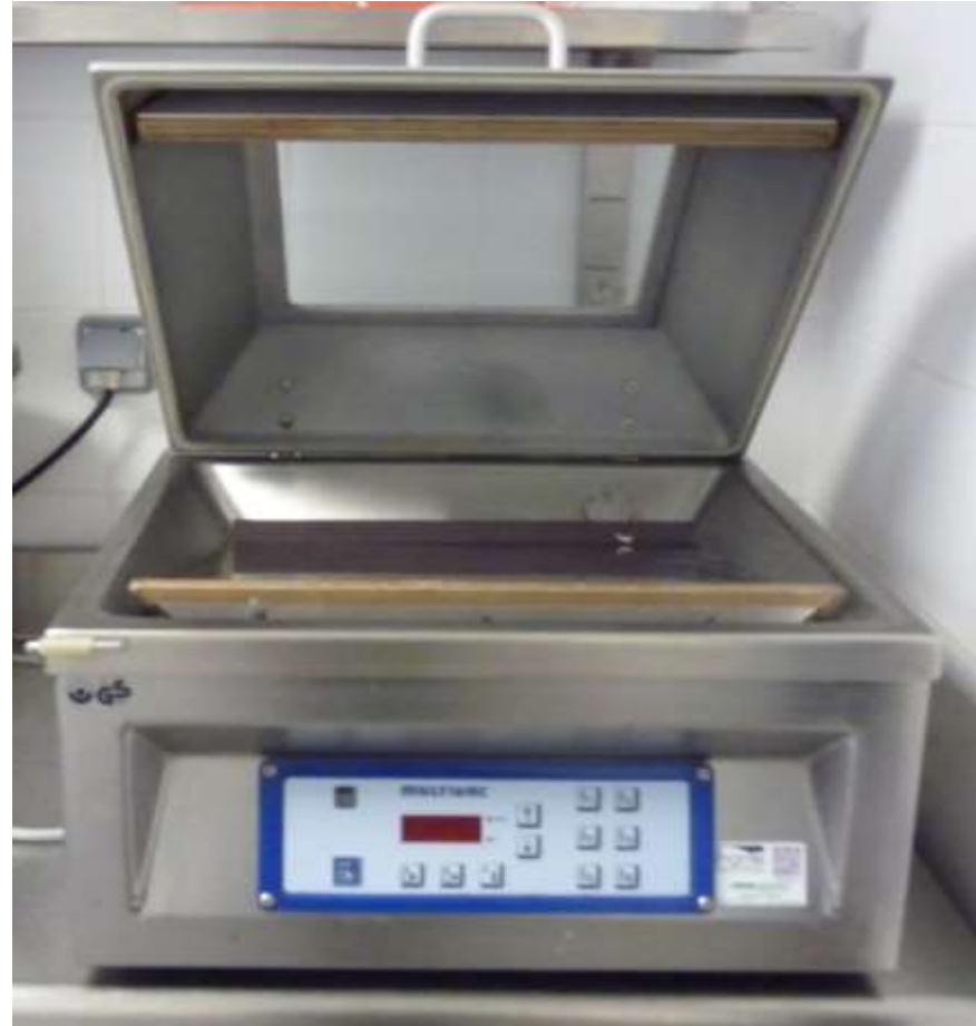
1 MACHINE SOUS VIDE

+ 4 BROYEURS INDIVIDUELS - PLAQUES DISPO : N° 3 - 4,5 - 8 et 12